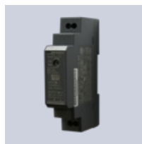
Transformator 24 VDC

Les mer om produktet: https://www.ebecoheating.no/produkter/snosmelting-mark/snowmat-0